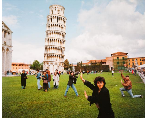
Scheve toren, Pisa, serie “Small World”

De omvangrijke tentoonstelling omvat elf fotoseries uit zijn gehele oeuvre, waaronder beroemde series als “Last Resort” (1983-86) over het strandleven in een Engelse badplaats, “Bored Couples”, “Small World” en de fotocollage “Common Sense” bestaande uit maar liefst 250 foto's waarin de ene mens zich slechts van de ander lijkt te onderscheiden door hetgeen hij consumeert.