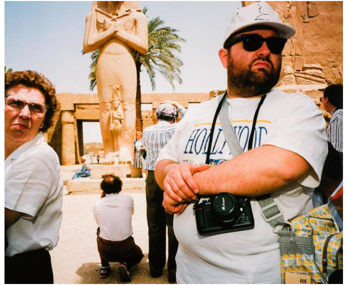
Tempel van Karnak, Luxor Egypte, serie "Small World"

Met een kritische blik, verleiding en humor toont Martin Parr menselijk gedrag in een massacultuur.