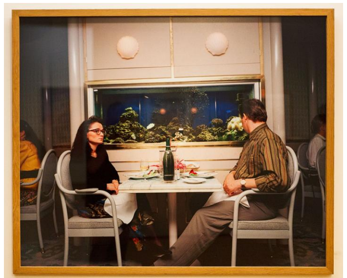
Veerboot Finland, serie "Bored Couples"

bezwaar wil maken loopt Parr gewoon door zonder daar aandacht aan te schenken. Hij kijkt de mensen die hij fotografeert meestal niet aan, zeker niet nadat hij de opname heeft gemaakt.