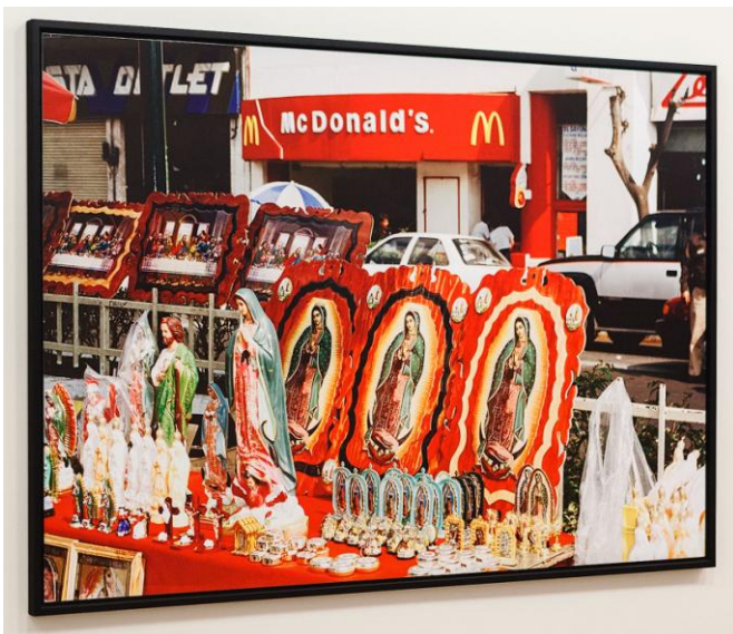
Madonna en McDonalds

Parr bereikt " zijn heldere, verzadigde kleuren " door de mensen van dichtbij te fotograferen en bijna altijd een (ring)flitser te gebruiken. Vroeger gecombineerd met Fuji of Agfa Ultra film, maar de laatste jaren gebruikt ook Martin Parr een digitale spiegelreflex. Als een gefotografeerde persoon