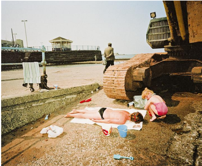
Brighton, Engeland, serie "Last Resort"

toeristen op vakantie aan de zuidkust van Engeland, die proberen van de ellende nog wat te maken en de toeristen die van de piramiden van Gizeh een toeristisch themapark lijken te maken.