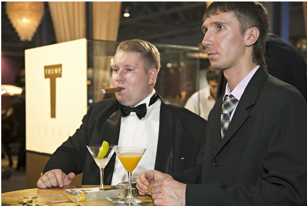
“The Millionaire Fair”, Rusland 2007, serie “Luxury”

De foto's zijn gemaakt met een kritische en humoristische kijk op de mensen en hun leefomgeving. Het levert foto's op die origineel, onderhoudend en vaak grappig zijn. Tegelijkertijd laten Parr's foto's ons zien hoe wij ons leven hebben ingericht, hoe wij onszelf aan anderen tonen en wat wij belangrijk vinden.