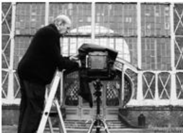
Bernd Becher aan het werk

Om de constructies, de “persoonlijkheid” van de gebouwen, te laten zien moest die dramatische sfeer worden weggelaten. Al snel merkten Bernd en Hilla dat de industriële fotografie, die toen al bestond, daar heel geschikt voor was. Bernd en Hilla waren gefascineerd door de gelijkenis in vormen waarin bepaalde gebouwen waren ontworpen. Bovendien waren ze geïntrigeerd door het feit dat er vaak veel aandacht was besteed aan het ontwerp van deze industriële gebouwen.