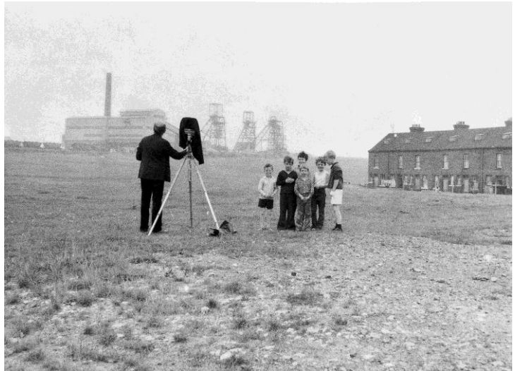
Bernd Becher aan het werk, Noord Engeland, 1968

Er bestond begin 20 e eeuw al wel een traditie van industrieschilders, die dramatische, zwaar aangezette doeken van industriële landschappen maakten. Maar die toonden nooit de gebouwen zelf.