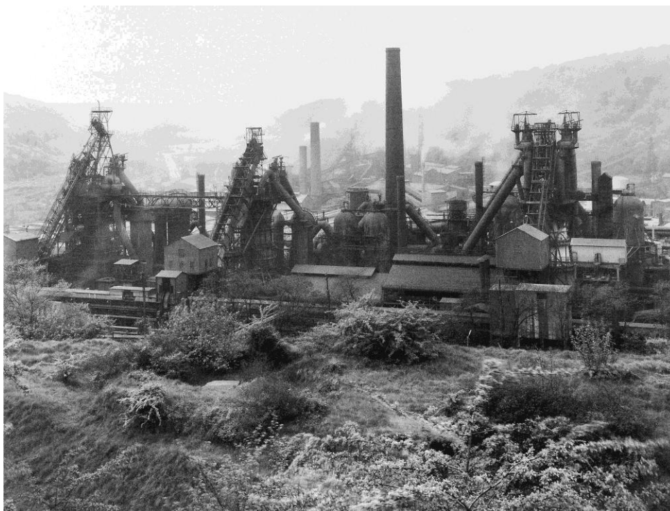
Industrieel landschap, Lotharingen (Frankrijk) 1971